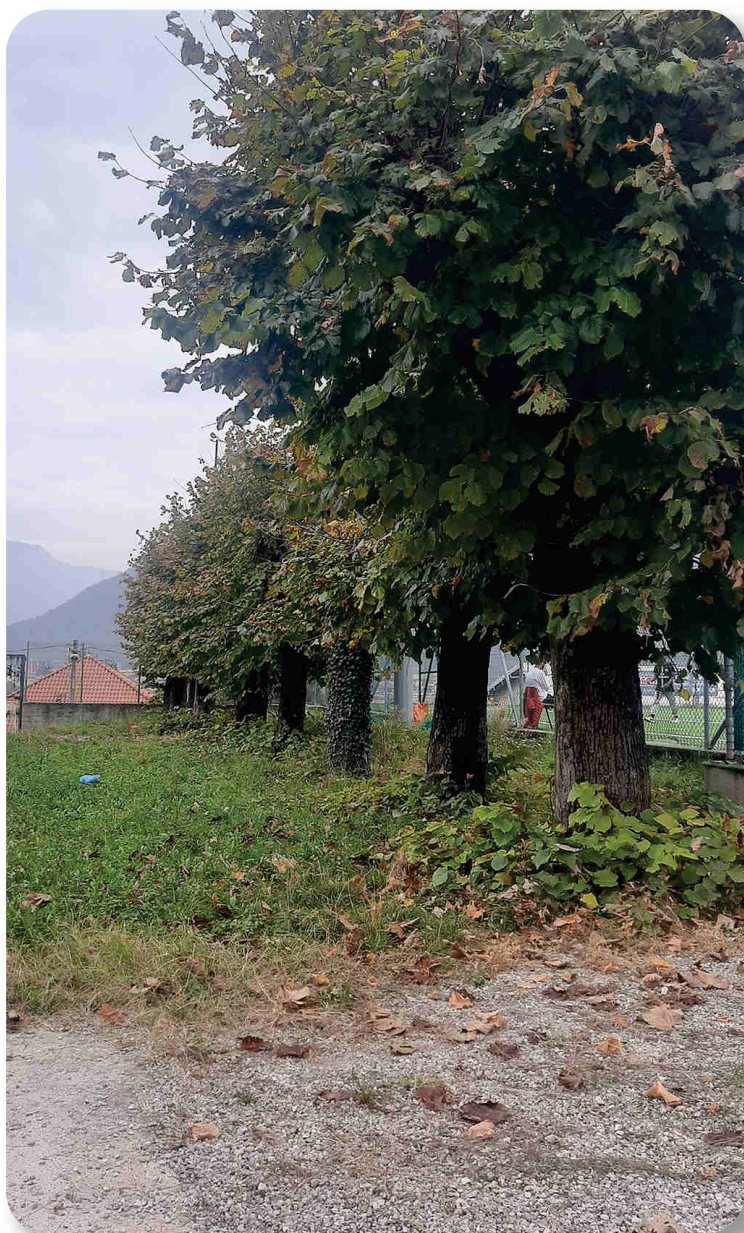
Zona a lato tribuna prima degli interventi di recupero

N el gennaio 2019 si è inaugurato il campo in sintetico dell'Oratorio di Valmadrera. L'investimento, del valore complessivo di circa 320.000 euro, comprende, oltre al campo stesso, il rifacimento dell'impianto di illuminazione e delle reti di bordo campo.