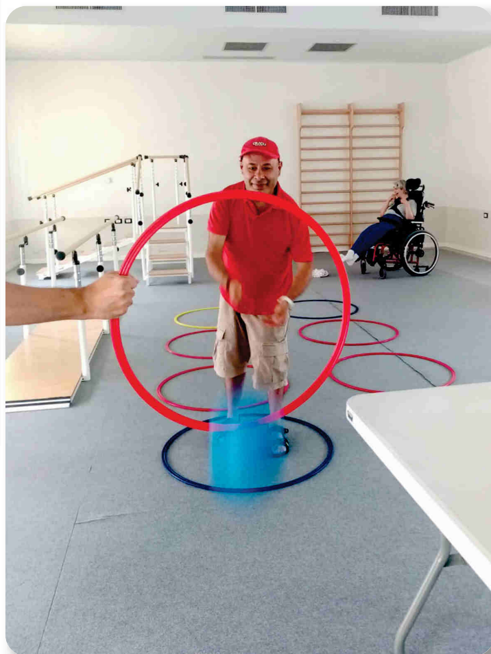
Momenti di attività