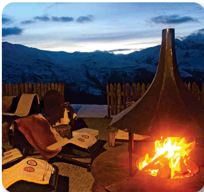
Suggerione notturna al "Camanel" di Livigno