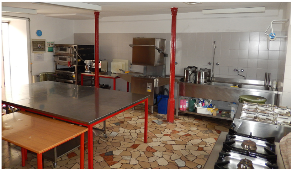
Scorcio della vecchia cucina

I privati, le famiglie, le attività e le istituzioni che intendono contribuire al progetto possono effettuare i versamenti a favore della Fondazione comunitaria del Lecchese Onlus, indicando nella causale: